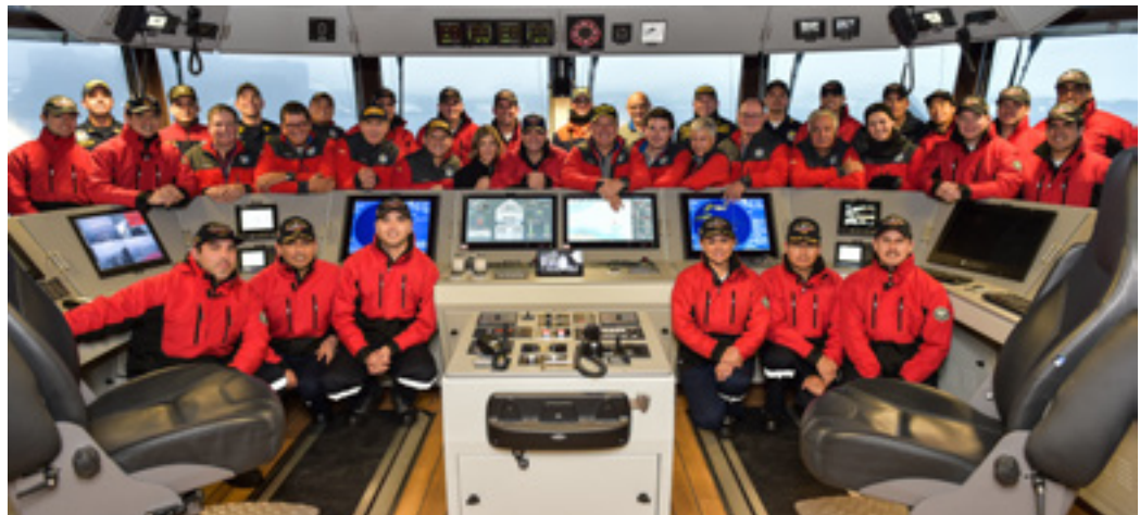
Imagen 4. Visita de la delegación colombiana al Buque B.A.P Carrasco.

Como parte de las actividades realizadas en el marco de esta visita, la delegación colombiana pudo conocer de primera mano las capacidades del buque oceanográfico peruano B.A.P Carrasco y de 7 bases antárticas: Base argentina “Carlini”, Base chilena “Profesor Escudero”, Base China “Great Wall”, Base coreana “King Sejong”, Gobernación Marítima de Bahía Fildes, Base rusa “Bellinghausen” y Base uruguaya “Artigas” (Imagen 4).