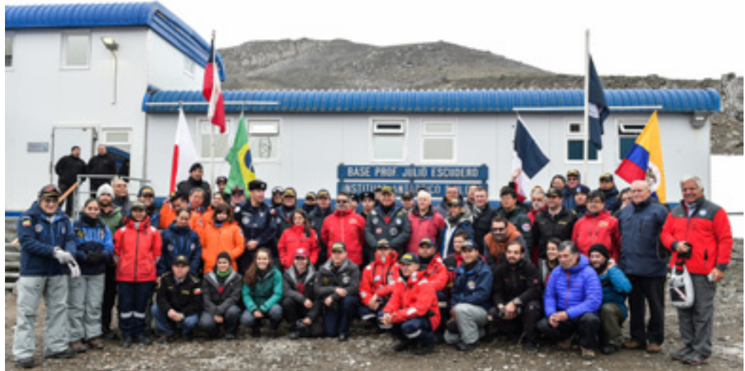
Imagen 3. Asistentes del Evento de divulgación del PAC realizado en colaboración con el INACH en la Base Antártica de Chile Profesor Escudero.

Como parte de las actividades realizadas en el marco de esta visita, la delegación colombiana pudo conocer de primera mano las capacidades del buque oceanográfico peruano B.A.P Carrasco y de 7 bases antárticas: Base argentina “Carlini”, Base chilena “Profesor Escudero”, Base China “Great Wall”, Base coreana “King Sejong”, Gobernación Marítima de Bahía Fildes, Base rusa “Bellinghausen” y Base uruguaya “Artigas” (Imagen 4).