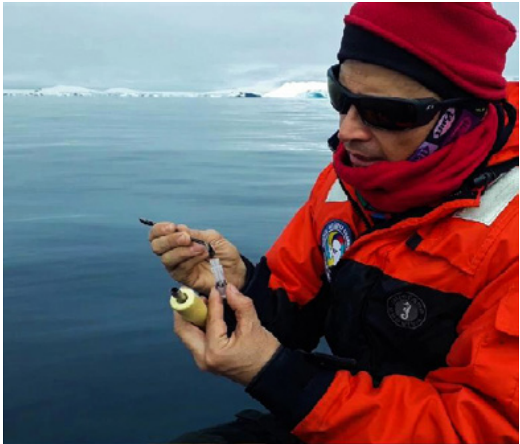
Imagen 6. Actividades de muestreo en Ballenas.