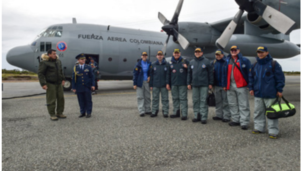
Imagen 1. Componentes de la Expedición "Almirante Tono".