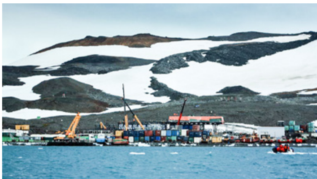
Imagen 8. Actividades para la determinación de los aspectos logísticos y operativos de cara al establecimiento y funcionamiento de la Estación Científica de verano “Almirante Padilla”.

El PAC es consciente que, en el proceso de implementación de sus 5 etapas de desarrollo, el intercambio de conocimiento es un eje fundamental y en esta expedición no ha sido la excepción. En este sentido, se identificaron 4 posiciones en las Bahías de Fildes y Almirantazgo y se consultaron 13 instalaciones antárticas, con el fin de determinar aspectos logísticos y operativos de importancia para el país en su propósito de construir en los próximos años una Estación Científica de Verano en el Continente Austral (Imagen 8).