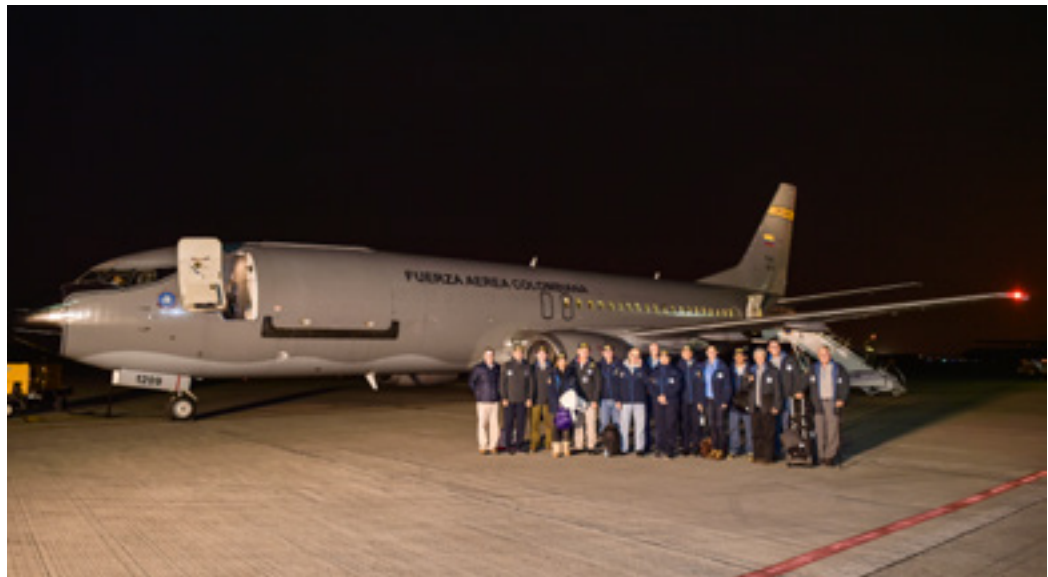
Imagen 2. Delegación del gobierno nacional y distinguidos miembros del sector empresarial y académico del país, quienes visitaron la Antártica entre el 2 y el 5 de febrero de 2018.

Con el fin de consolidar el compromiso de Colombia en el desarrollo de ciencia de la más alta calidad en el Continente Antártico, el Programa Antártico Colombiano planificó la visita al Continente Austral realizada entre el 02 y 05 de febrero de 2018 por una delegación compuesta por autoridades del gobierno nacional y distinguidos representantes del sector académico y empresarial del país (Imagen 2).